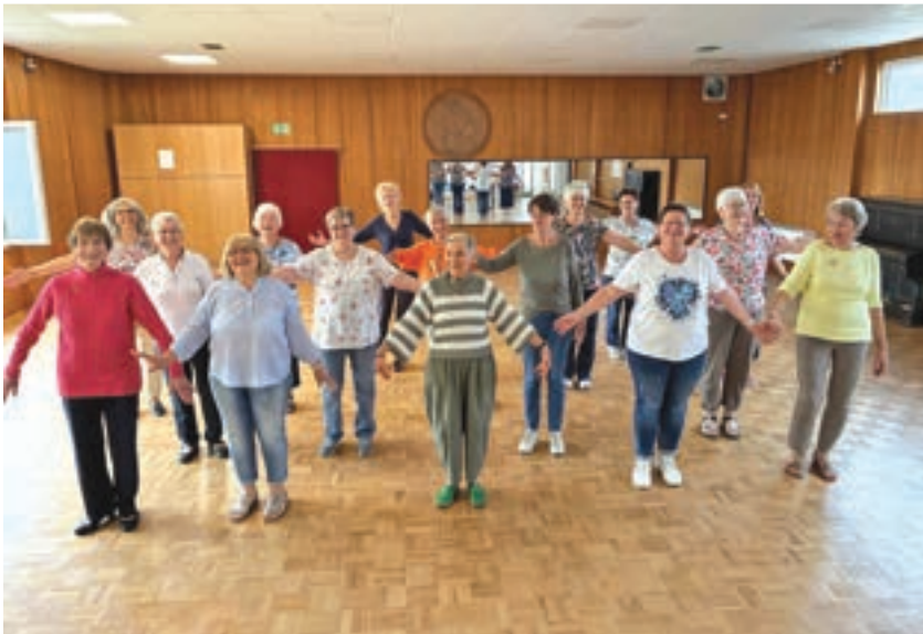
Ein Blocktanz zum Auflockern