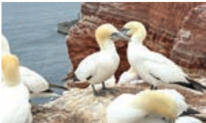
Tölpel auf Helgoland

Da Hemmoor besonders an Wochenenden sehr gut besucht ist und auch viele internationale Taucher anzieht, entschieden sich die meisten von uns am Samstag für einen Ausflug nach Helgoland. Gemeinsam fuhren wir früh morgens nach Cuxhaven und bestiegen um 9:30 Uhr die MS Nordlicht II der Reederei Cassen-