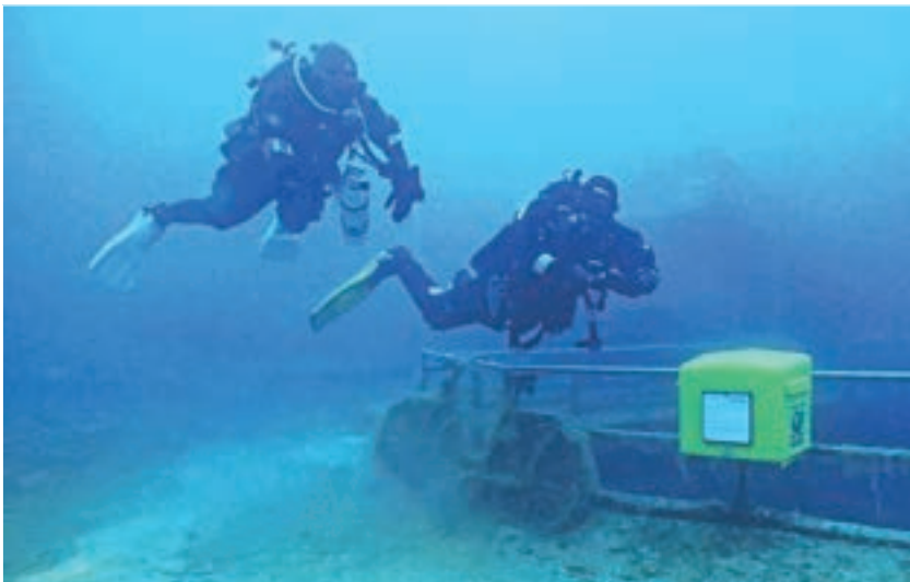
Der Briefkasten in Hemmoor

Nach vielen Jahren, in denen uns unsere Vereinsfahrten in die warmen Gewässer des Roten Meeres nach Ägypten geführt hatten, wollten wir diesmal ein Ziel anbieten, das für alle gut erreichbar ist - und was liegt da näher, als eines der schönsten und bekanntesten Tauchreviere Deutschlands auszuwählen, das zudem in unserem eigenen Bundesland liegt? So führte uns unsere Vereinsfahrt im Juli 2025 für eine Woche ins wunderschöne Hemmoor im Landkreis Cuxhaven. Der dort gelegene Kreidesee umfasst rund 33 Hektar und entstand durch einen ehemaligen Tagebau, in dem von 1862 bis 1976 Kreide abgebaut und direkt vor Ort in einer angeschlossenen Zementfabrik verarbeitet wurde. Heute erinnert der „Zementrundweg“ rund um den See an diese Geschichte. Nach Ende des Abbaus wurden die Pumpen abgestellt, sodass sich die Grube bis 1982 mit Grundwasser füllte. Die ursprünglich etwa 130 Meter tiefe Grube wurde später durch Verfüllung mit Trümmern und Bauschutt auf rund 60 Meter Tiefe reduziert.