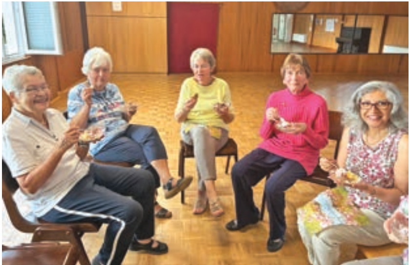
Stärkung in der Pause