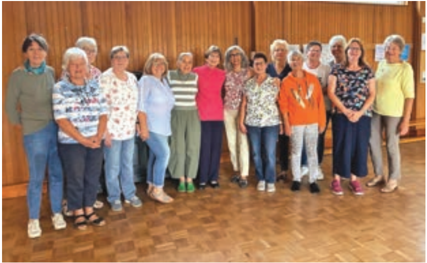
Folkloregruppe im Juli 2025