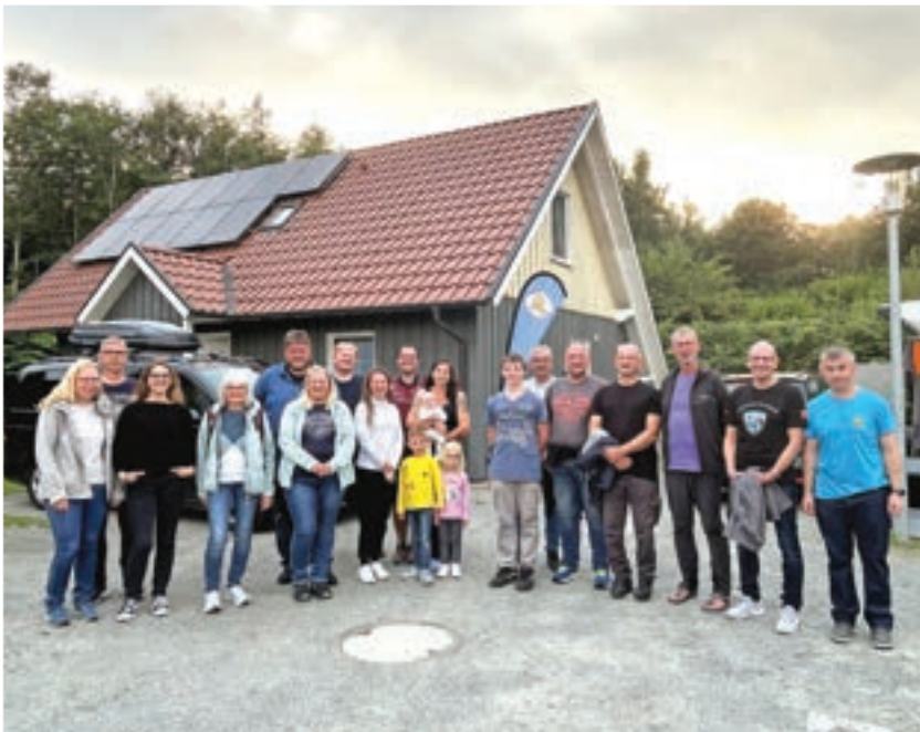
Die Teilnehmer der Vereinsfahrt

Insgesamt haben unsere 19 tauchenden Teilnehmer an sechs Tagen 133 Tauchgänge gemacht, mit einer Gesamtzeit unter Wasser von knapp 26 Stunden und einer durchschnittlichen Tauchzeit von 43 Minuten auf einer Durchschnittstiefe von 25 Metern. Beeindruckend, oder?