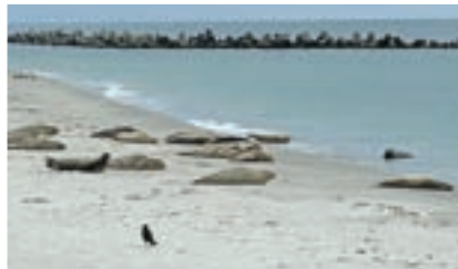
Kegelrobben auf Düne